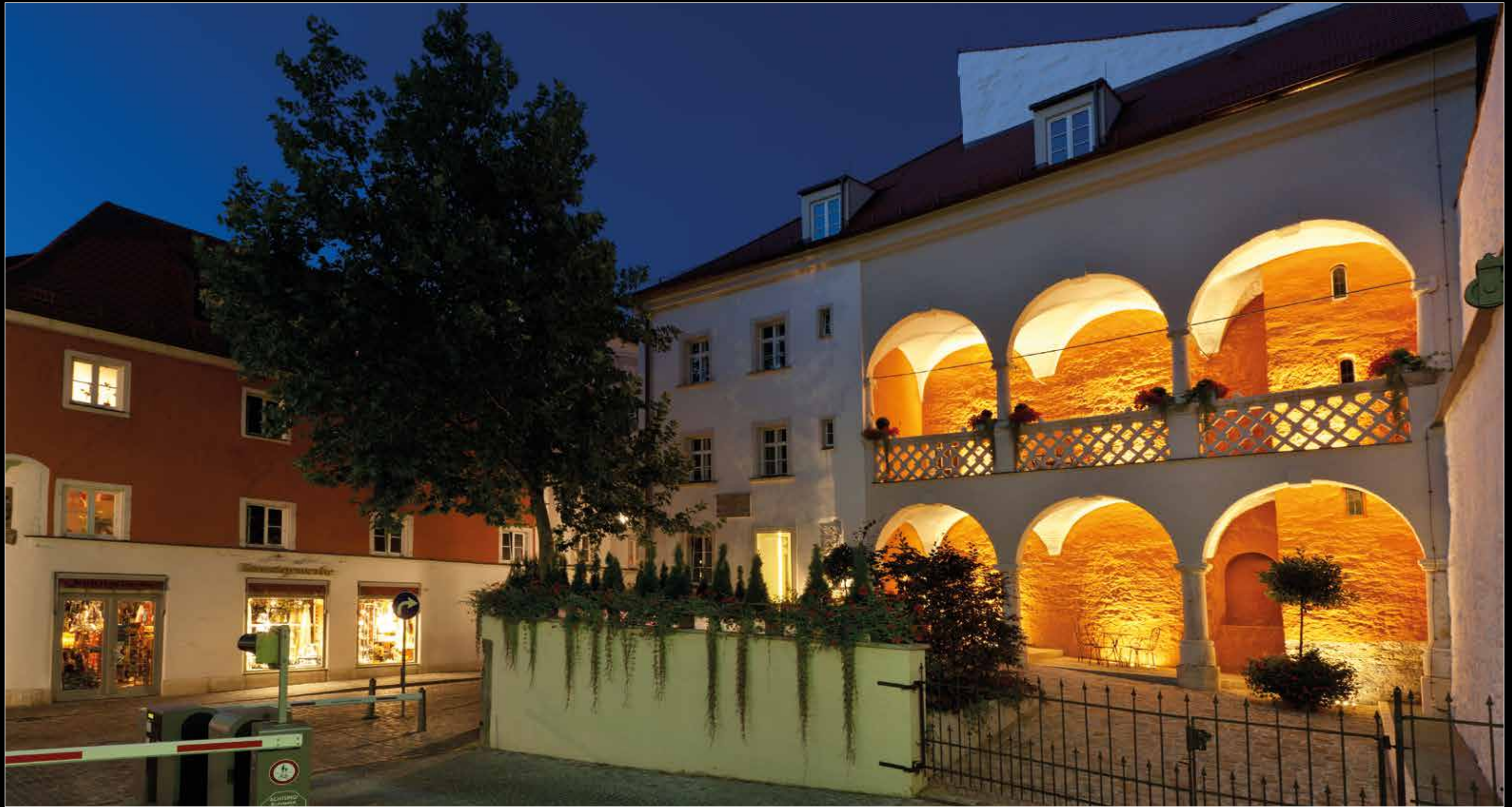
Alte Brauerei Bischofshof