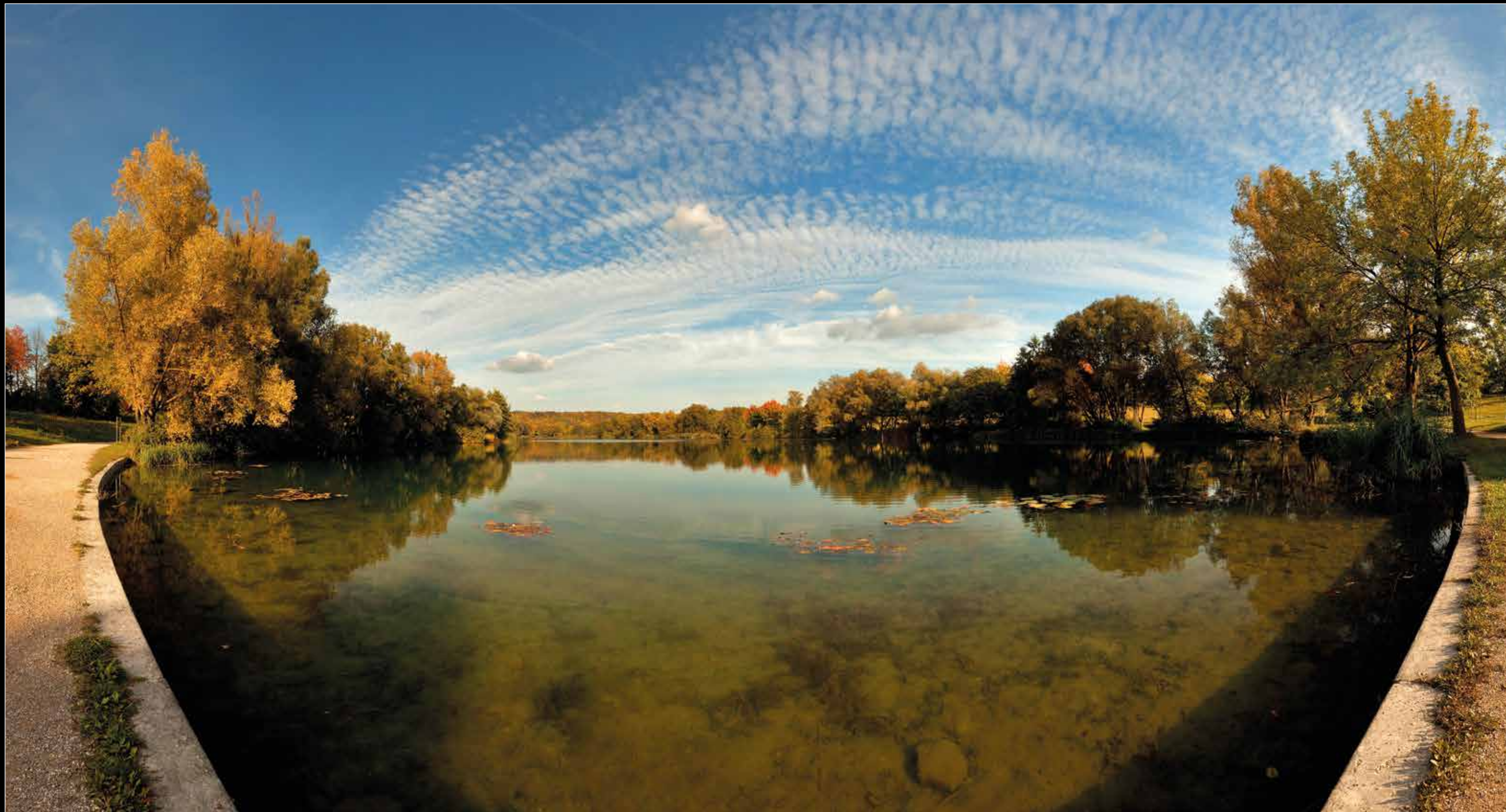
Goldener Oktober am Westweiher