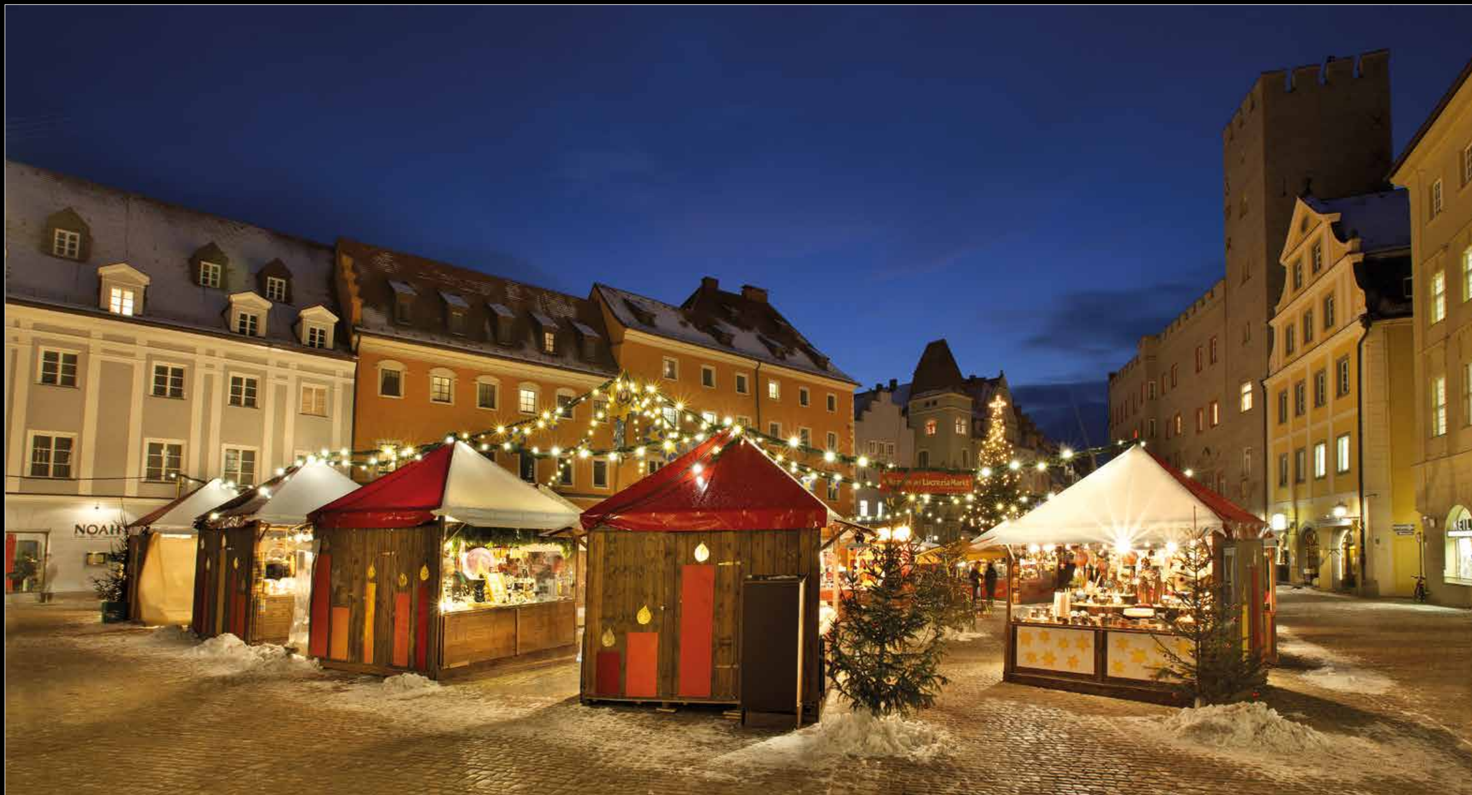
Lucrezia - Markt am Haidplatz