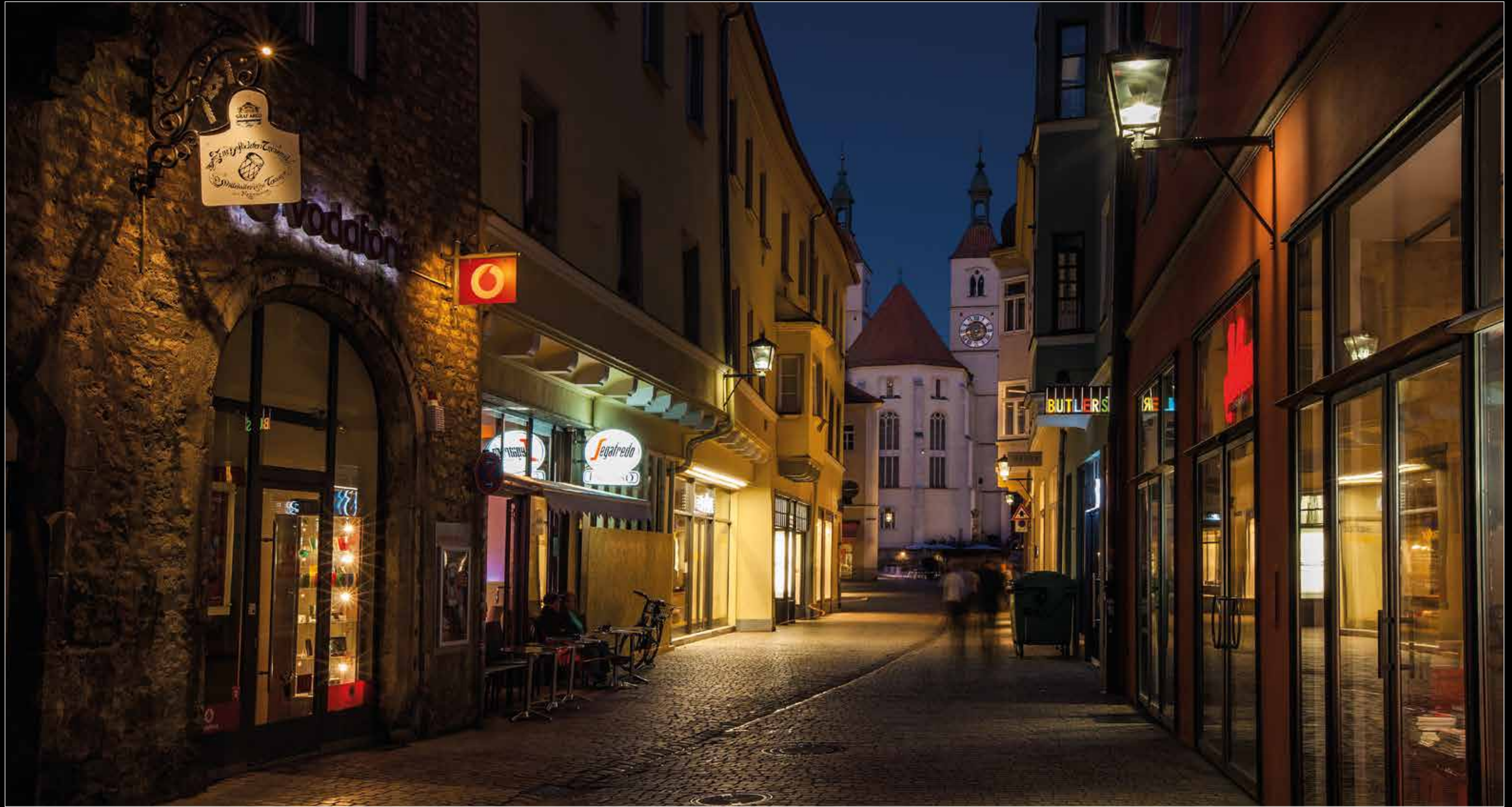
Blick zur Neupfarrkirche