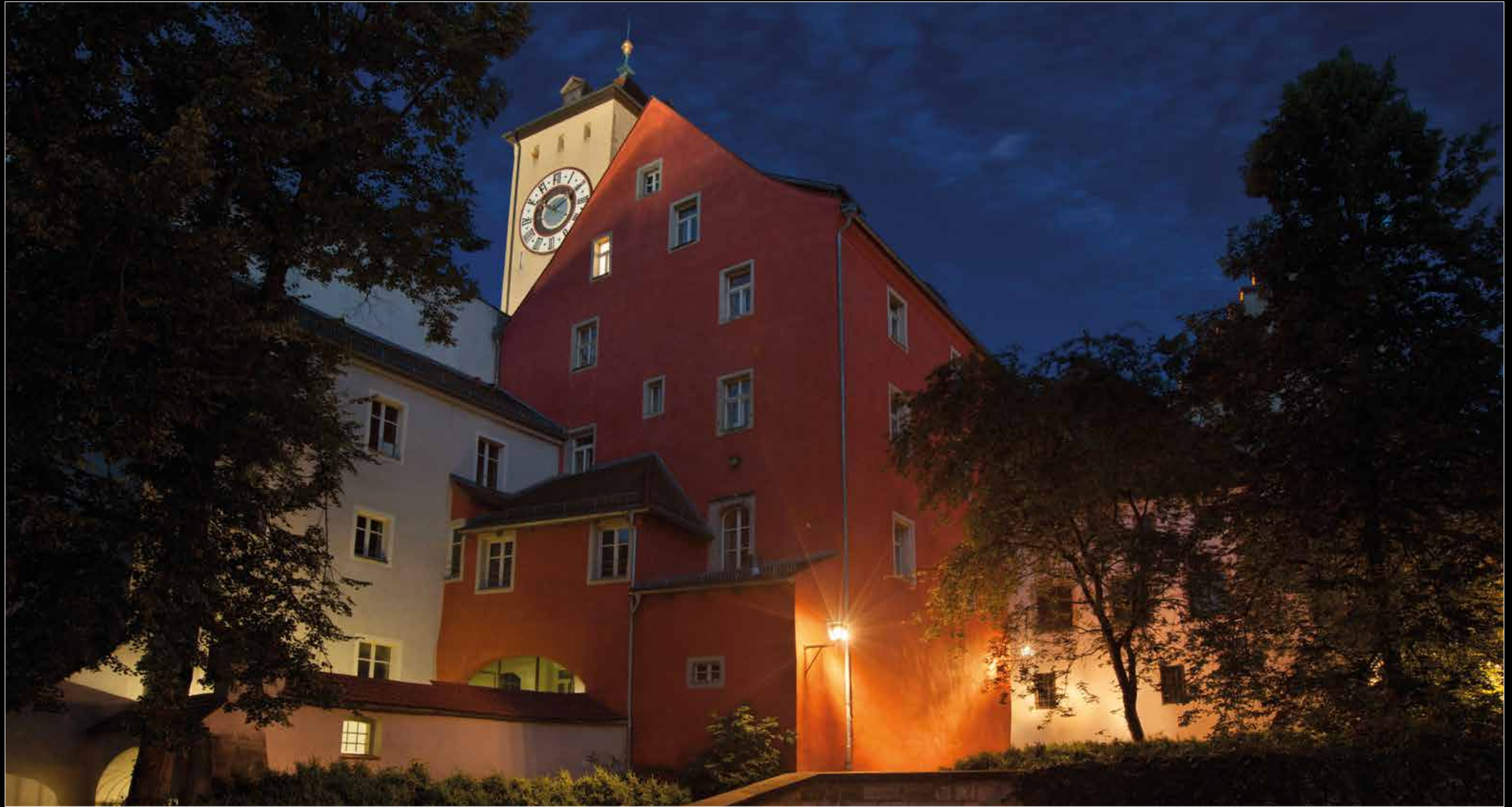
Roter Herz Fleck