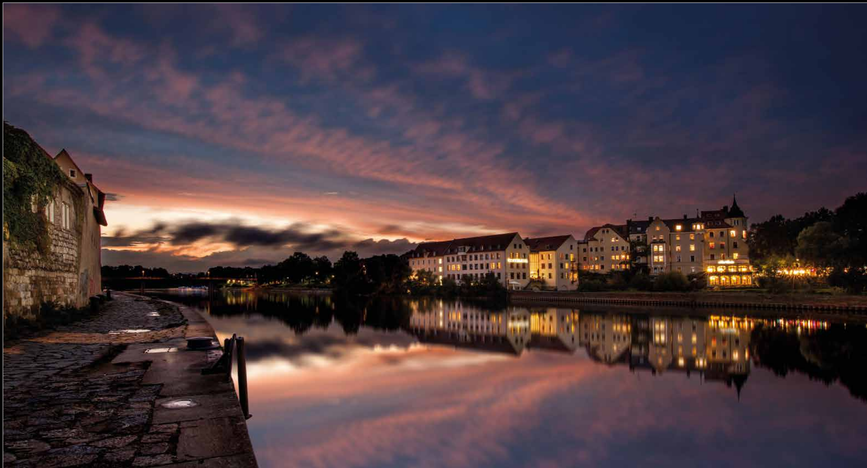
An der Weinlände