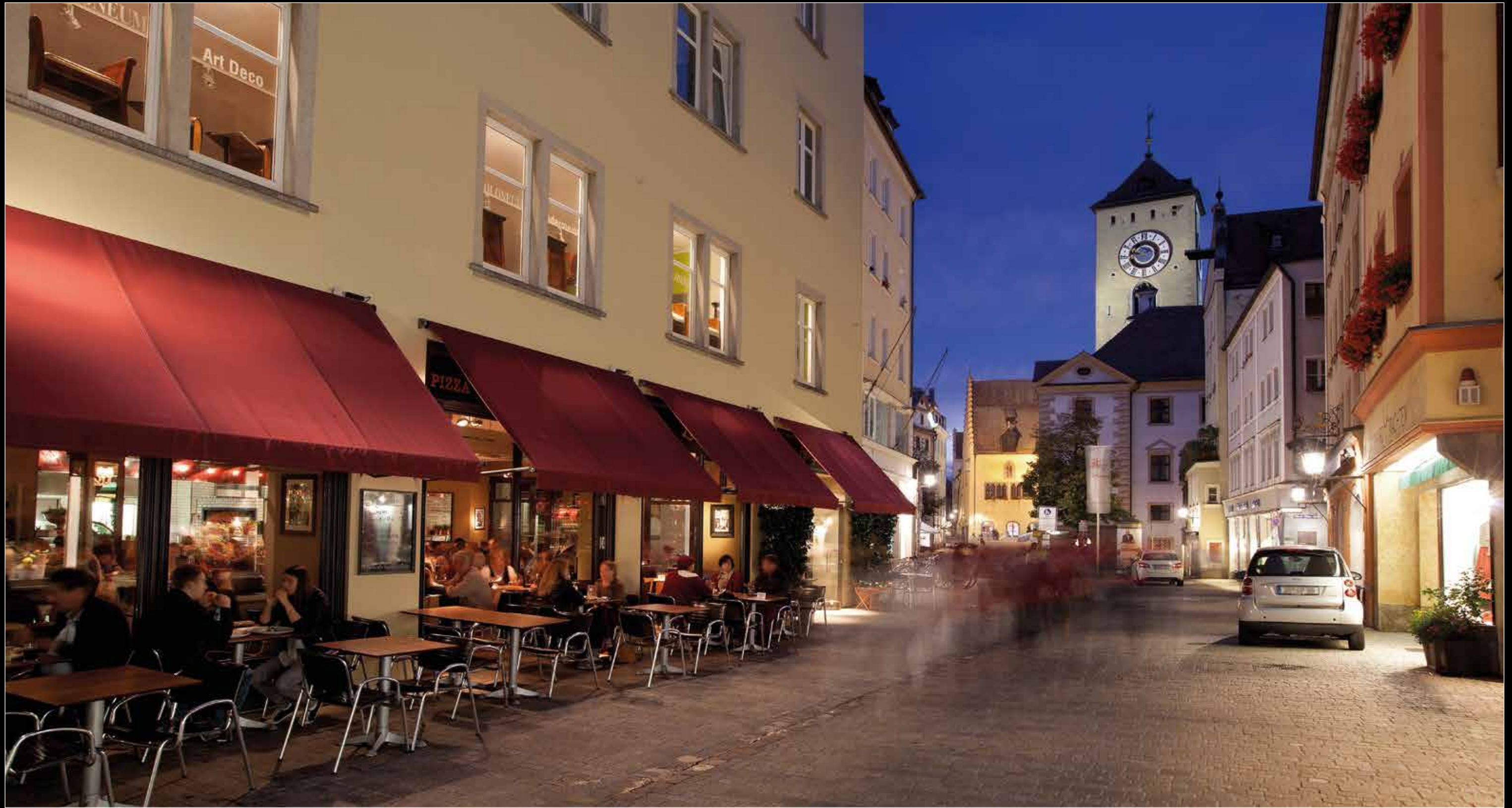
Goliathstraße mit Blick zum Rathausturm